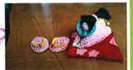
見ざる聞かざる言わざる