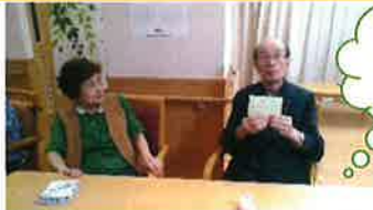
仲のいいご夫妻様