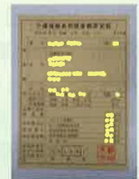
負担限度額認定証(黄色)

*入院される際には後期高齢者証と一緒に担当ケアマネジャーの名刺も添えて病院受付にお出ください。