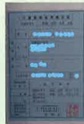
介護負担割合証(水色)

8月より保険証類が切り替わりの時期となります。新しいものが皆様のお家にも届いてる頃だと思います。確認させていただく為、ご利用中の各事業所にご提示ください。宜しくお願い致します。